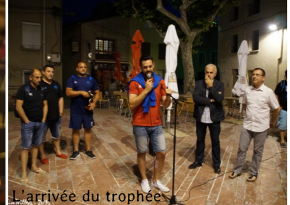
L'arrivée du trophée