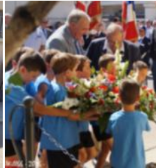
Les jeunes du club ont déposé une gerbe