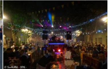
Ambiance autour de notre super DJ au cœur de la bodega