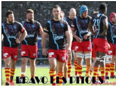
LE RAVO LES DITOUS