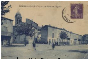
À un siècle d'intervalle...