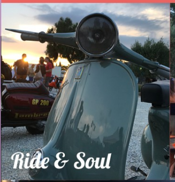
Ride & Soul