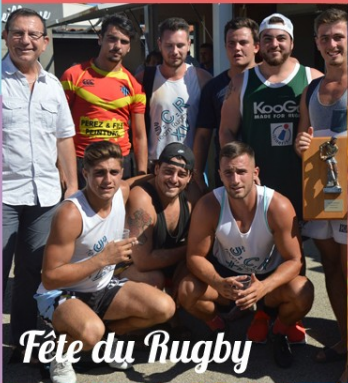
Fête du Rugby