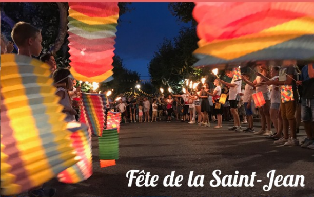
Fête de la Saint-Jean