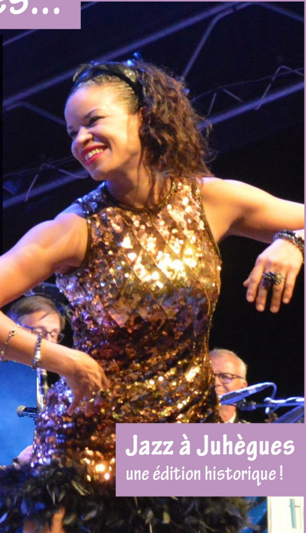
Jazz à Juhègues une édition historique !