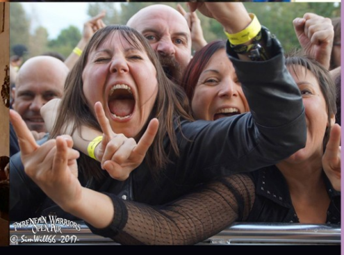
Pyrenean Warrior Open Air Metal hurlant !