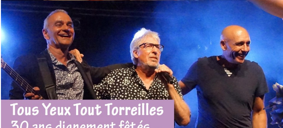
Tous Yeux Tout Torreilles 30 ans dignement fêtés...