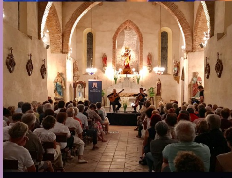
Estiu musical Classique et découvertes