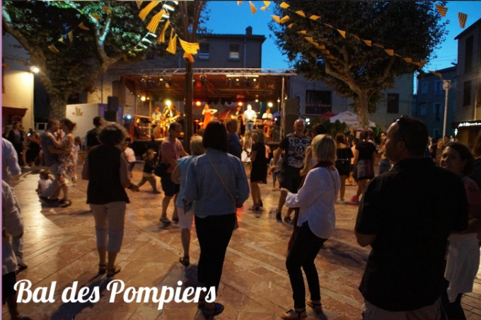
Bal des Pompiers