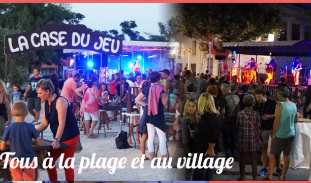
Tous à la plage et au village