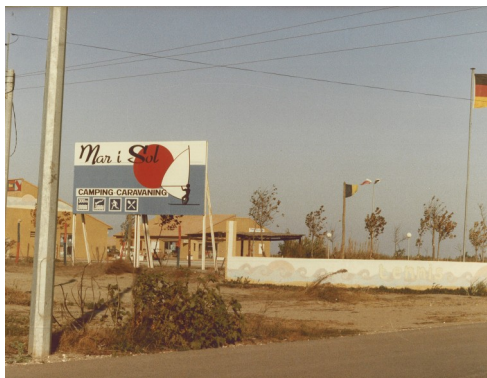
Le Camping Mar i Sol - 70's