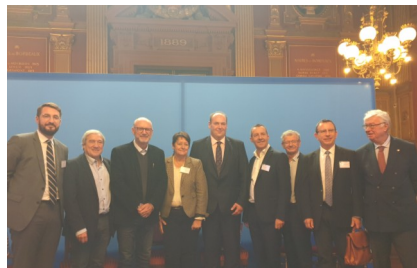
Les élus d'Occitanie aux côtés du président de l'ANEL

Depuis plus de 40 ans, l'ANEL (Association Nationale des Elus du Littoral) rassemble les élus des collectivités littorales de métropole et d'outre-mer autour des enjeux spécifiques du développement économique et de la protection de ces territoires. Comme chaque année, M. le maire a participé à ces journées d'études qui se sont déroulées en fin de semaine dernière à Bordeaux et ont été l'occasion d'aborder l'actualité et les diverses problématiques à travers la thématique "Décentralisation : cap sur les territoires littoraux". Autour de différents ateliers : aménagement des territoires littoraux, gestion des ressources naturelles et économie circulaire, économie bleue, financement de l'adaptation des territoires menacés par l'érosion côtière, les élus ont pu travailler, réfléchir et confronter leurs expériences et opinions pour répondre aux enjeux actuels et futurs du changement climatique. Une expérience enrichissante qui a également mis en lumière la nécessaire concertation avec les services de l'Etat et l'importance de l'expérimentation pour la co-construction de projets de territoire innovants et d'avenir.