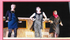
Les poupées anciennes

La pièce de théâtre "Les poupées anciennes" aura lieu ce vendredi 8 novembre à 21h à la salle des fêtes. Une comédie farfelue dans laquelle 3 amies d'enfance se retrouvent après s'être perdues de vue depuis 30 ans. Entre chansons et anecdotes, ces trois personnages vous emmènent, chacun à sa manière, dans leur univers surprenant. Entrée 8€ - gratuit pour les moins de 12 ans.