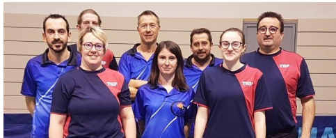
Torreilles vs Lezignan - régionale 2