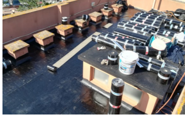
Etanchéisation du toit de l'école de musique