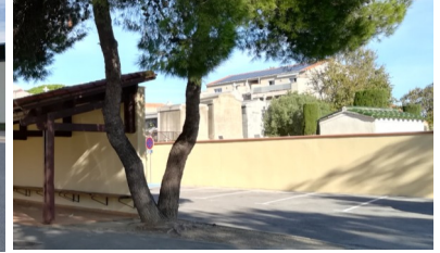
Peinture de la façade du cimetière