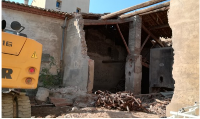
Démolition avenue des Pyrénées

La circulation avenue des Pyrénées a été perturbée ces deux dernières semaines par le chantier de démolition d'une grange. Ce bâtiment, propriété de la mairie menaçait ruine et était potentiellement dangereux pour les riverains et les personnes empruntant le boulevard. Afin de sécuriser cet espace, des travaux de démolition ont été réalisés avant que ne soit étudiée la possibilité d'y construire des logements sociaux. D'autres travaux ont aussi eu lieu ces derniers jours dont l'étanchéisation du toit de l'école de musique et la finalisation du terrain de basket pour le 3x3 au city stade permettant ainsi l'entraînement professionnel. En parallèle, la façade du cimetière a repris des couleurs et la porte de la salle des fêtes a été remplacée.