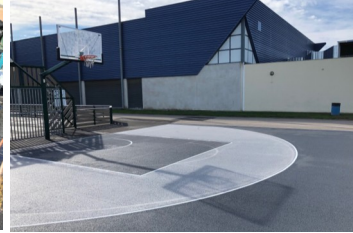
Terrain de basket pour le 3x3