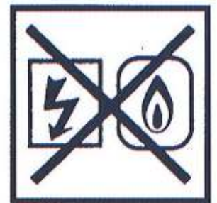
Coupez l'électricité et le gaz