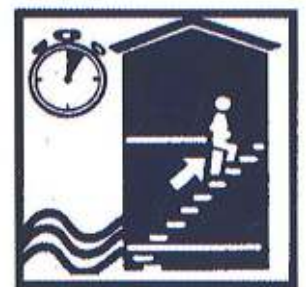
Montez à pied dans les étages