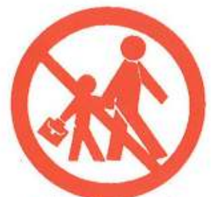
N'allez pas chercher vos enfants à l'école : l'école s'occupe d'eux