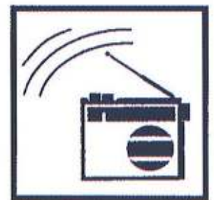
Écoutez la radio pour connaître les consignes à suivre