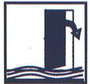
Fermez la porte, les aérations